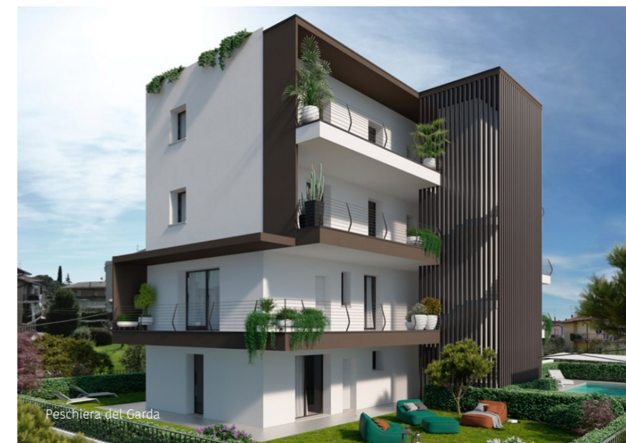
Peschiera del Garda

I prezzi del mercato residenziale di pregio hanno registrato un aumento nell'ultimo anno, la quotazione degli immobili nuovi nelle migliori location è compresa nel range 5.000-6.000 euro/mq, mentre la quotazione per immobili usati abitabili dell'entroterra va da 2.000