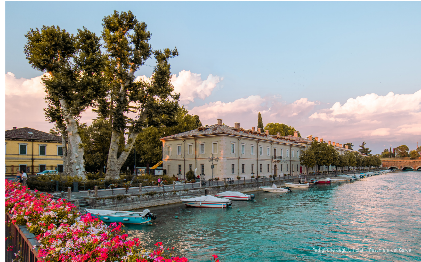
Padiglione degli Ufficiali - Peschiera del Garda

Es handelt sich um Häuser mit Außenbereich, Garten oder Terrasse, mit oder ohne Schwimmbad, mit mittlerer bis großer Größe, sowie um Häuser mit Panoramablick oder in unmittelbarer Nähe zu den Nachbarstädten am See. Doppelhaushälften oder freistehende Villen, neu oder vor kurzem gebaut, aber in gutem Zustand, angesichts des Trends zu Neubaulösungen in fortschrittlicher Energieklasse, oder auch Häuser mit historischem Flair oder im Jugendstil, die eine komplette Renovierung